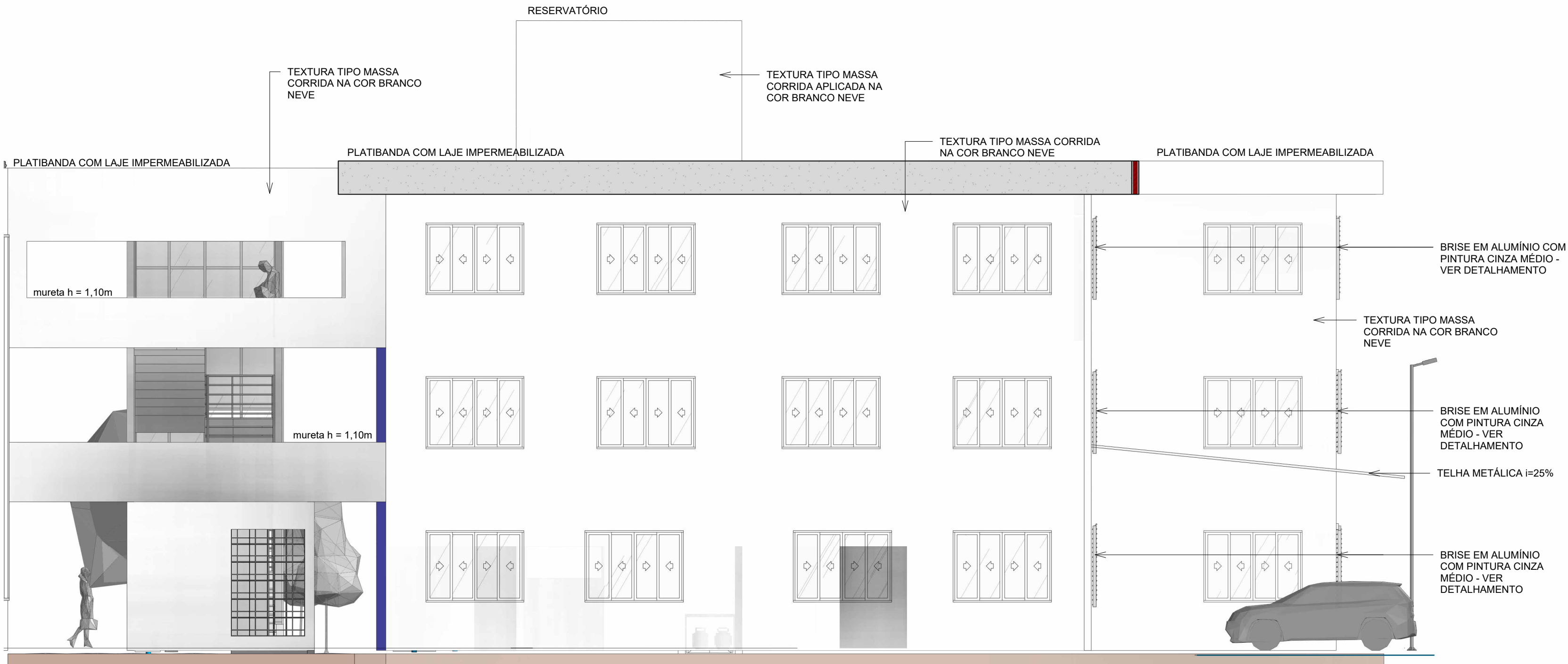
FACHADA 4 - BPM